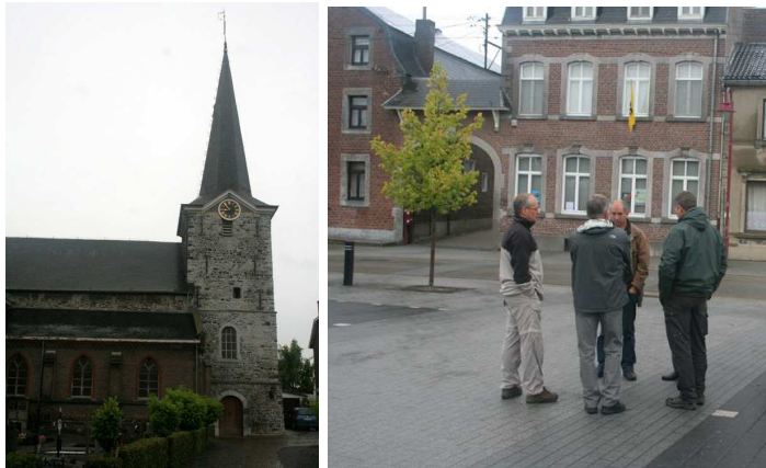
Samenkomst aan de kerk te Moelingen om 9.00 u

De Gulp is een snelstromende heuvellandbeek met een grindbodem en de te verwachte soorten zijn stroomminnende vissoorten.