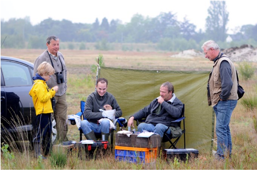
Vogels ringen op Maatheide

Eenden, ganzen, meeuwen en steltlopers worden er al op grote afstand door aangelokt. Ze vallen in, vliegen rond om zich er roepend van te vergewissen of er soortgenoten aanwezig zijn, of reizen voort na de conclusie dat de voedselarme plassen en schrale oevers hen weinig te bieden hebben.