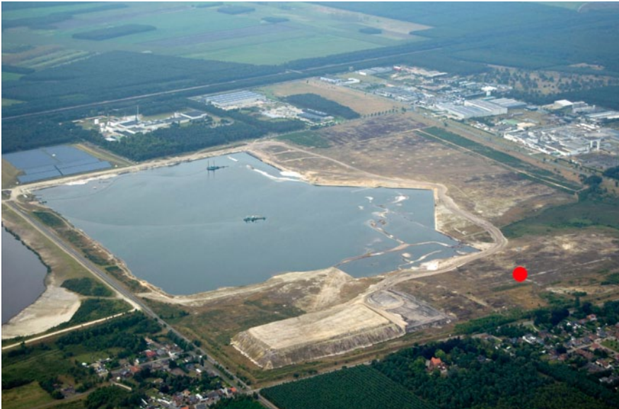
Figuur 1. Luchtfoto Maatheide met situering trektepost (rode bol)

makkelijk op en genereren dus snel stijgende lucht. Roofvogels zoals buizerds, wespensieven en bruine kiekendieven maken daarvan gebruik. Vanaf Maatheide is te zien hoe zij al cirkelend samenkomen in bellen van soms wel tientallen exemplaren. Een machtig gezicht waar elk jaar naar wordt uitgekeken.