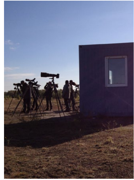
Overuren op de telpost

Een aantal soorten trekt ook 's nachts en veel zelfs uitsluitend! Om de nachtelijke trek over Maatheide enigszins te kunnen ontsluiten hebben de vogelringers Andy en Karel Vanendert in de najaren van 2010, 2011 en 2012 trekvogels naar beneden gelokt door hun specifieke roepjes af