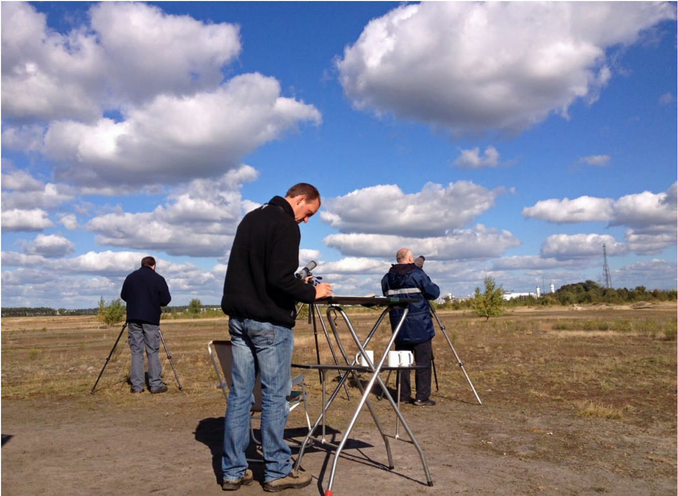
Trektellers op maatheide

zeer extreme trek. Met maar liefst 277 000 overtrekkende vogels maakten de tellers die dagen overuren.